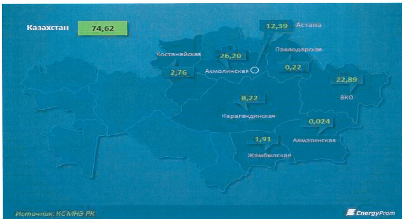
Рисунок 4 – Производство золота в Казахстане по регионам, тн

Основными производителями золота являются компании: ТОО «Казцинк» (включая Altyntau Kokshetau), АО «АК Алтыналмас», ТОО «Корпорация Казахмыс», Kaz Minerals PLC и Polymetal International PLC, RG Gold.