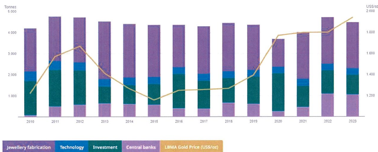
Рисунок 3 – Статистика мирового спроса на золото в динамике

Общий спрос на золото в мире (с учетом внебиржевого рынка) в 2023 г. увеличился на 3% к предыдущему году и достиг рекордного уровня в 4899 т. Об этом говорится в отчете Всемирного совета по золоту (WGC) от 31 января. В IV квартале общий спрос снизился на 0,2% к III кварталу и составил 1221 т.