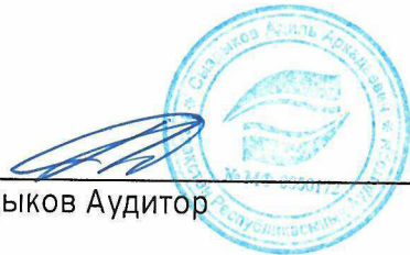
Адиль Сыздықов Аудитор

Аудитордың 2013 жылғы 23 желтоқсандағы № 0000172 біліктілік куәлігі