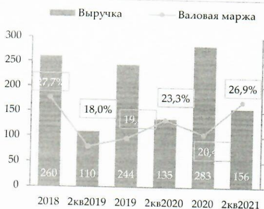
Динамика выручки и валовой маржи (в млрд. тенге)