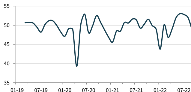
Tengri Partners PMI Обрабатывающих отраслей Казахстана ск, >50 = улучшение по сравнению с прошлым месяцем