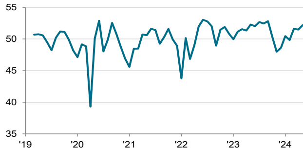
S&P Global PMI обрабатывающих отраслей Казахстана ск, > 50 = улучшение по сравнению с прошлым месяцем

Незначительный прирост новых заказов главным образом объясняется активизацией спроса в отрасли. Благодаря ему также произошло четвертое подряд увеличение объемов производства. Текущий рост объемов стал существенным,