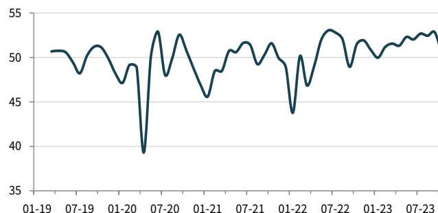
Tengri Partners PMI® Обрабатывающих отраслей Казахстана ск, >50 = улучшение по сравнению с прошлым месяцем

Источники: Tengri Partners, S&P Global PMI.